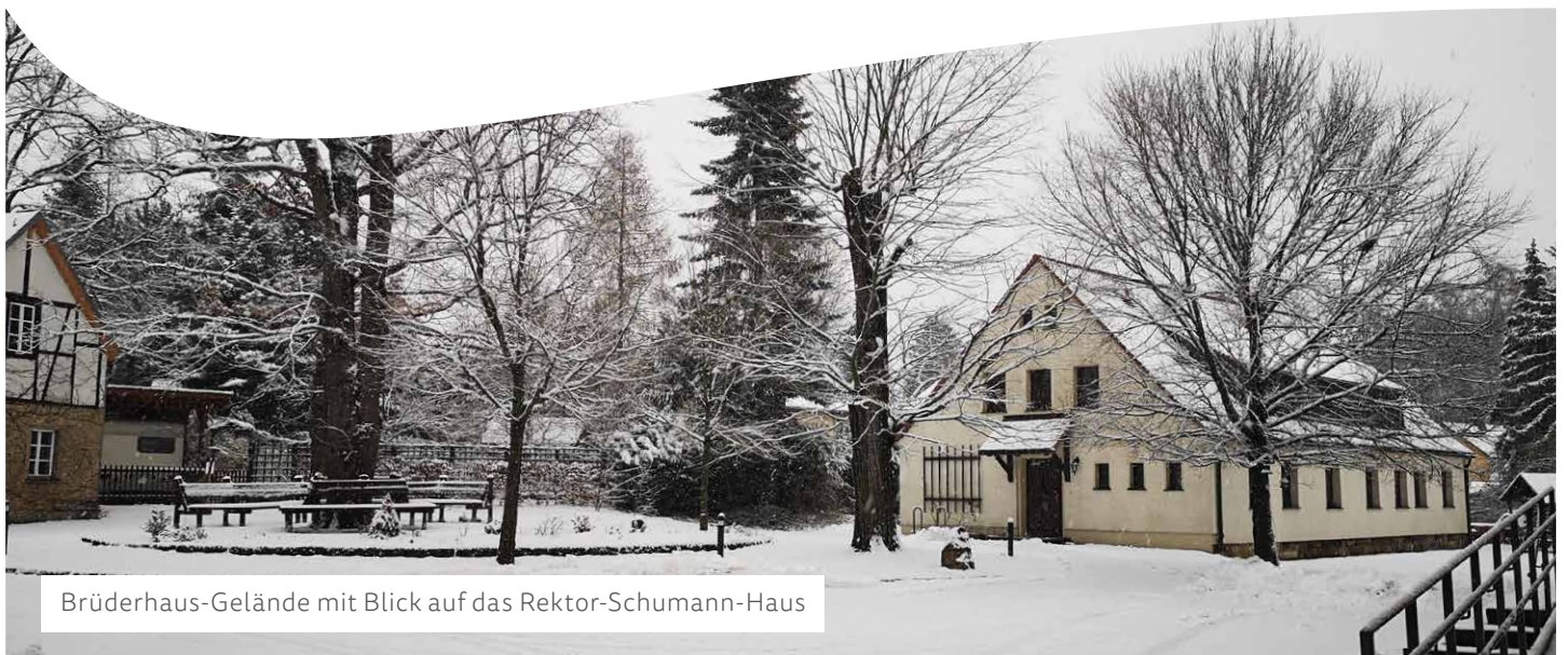
Brüderhaus-Gelände mit Blick auf das Rektor-Schumann-Haus