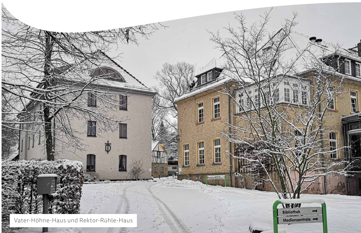
Vater-Höhne-Haus und Rektor-Rühle-Haus